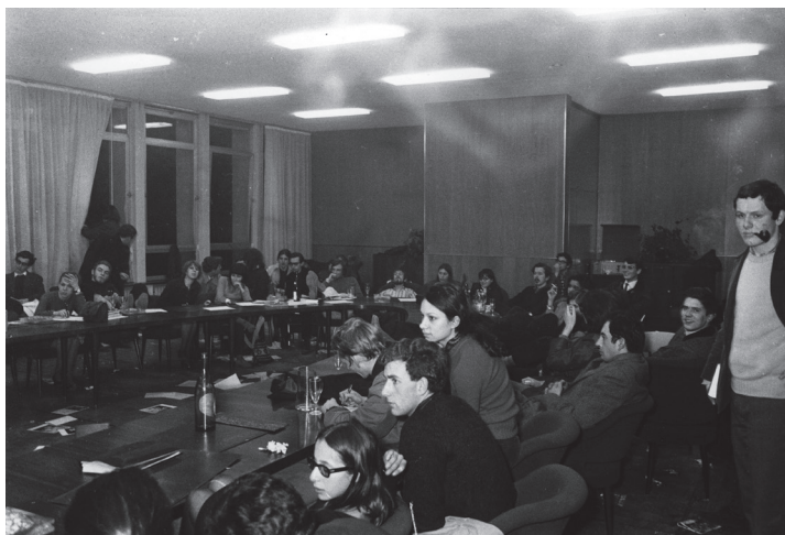
L'occupation de la Salle du Conseil de l'Université, 22 mars 1968 © Gérard Aimé, Gamma-Rapho.